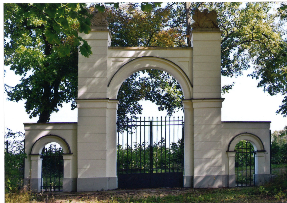
Fot. 2. Widok od zachodu (od strony parku), 2022.

Arkada środkowa wsparta na węższych filarach zamkniętych również prostym profilowaniem w postaci płaskiej listwy i półki. Lico łuku płaskie z uskokiem u góry. Nadłucze prostokątne, zabezpieczone od góry piaskowcowymi płytami o szrafowanych bokach. Pachwiny łuku arkadowego w postaci zdwojonej płyciny o kształcie zbliżonym do trójkąta. Boczne arkady wpisane w prostokątne ścianki zakończone prostym profilowaniem w postaci listwy i przykryte kamiennymi płytami o analogicznej dekoracji boków. Filary arkad bocznych szersze od ścianek również zakończone prostymi listwami. Czoła łuków analogicznie profilowane. Partie przyziemia bramy z wyodrębnionym, wysokim cokołem. Gzysmy i łuki arkadowe zabezpieczone od góry obróbkami blacharskimi. Bramka metalowa, dwuskrzydłowa, ażurowa u góry i pełna na wysokości cokołu. Wykonana z pionowych prętów o trójkątnych zakończeniach, połączonych poziomymi prętami, dwoma u góry i jednym u dołu. Furty o analogicznym wykonaniu, w całości ażurowe.