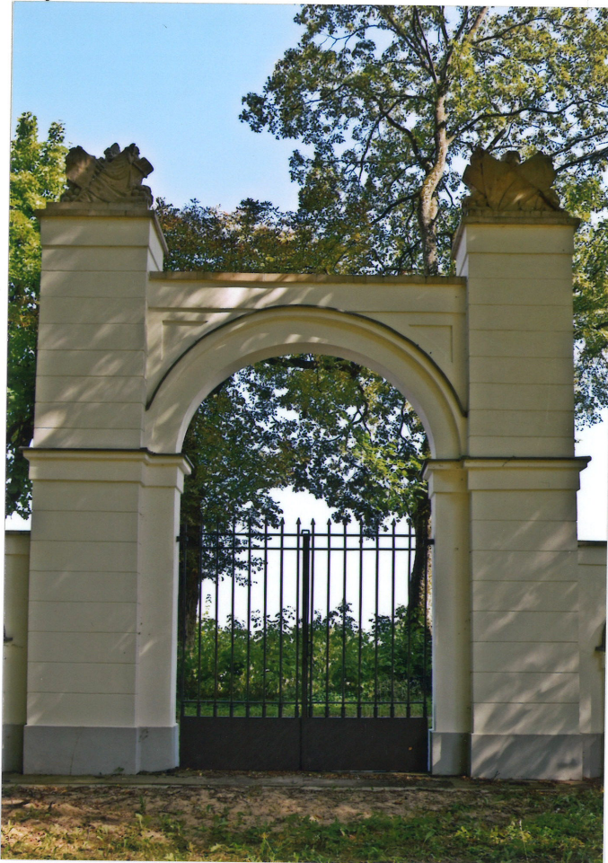
Fot. 3. Widok od zachodu (od strony parku), arkada środkowa, 2022.