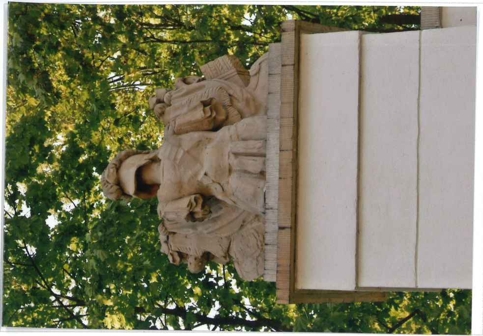
Fot.6. Widok od zachodu (od strony parku), rzeźba wieńcząca północna, 2022.