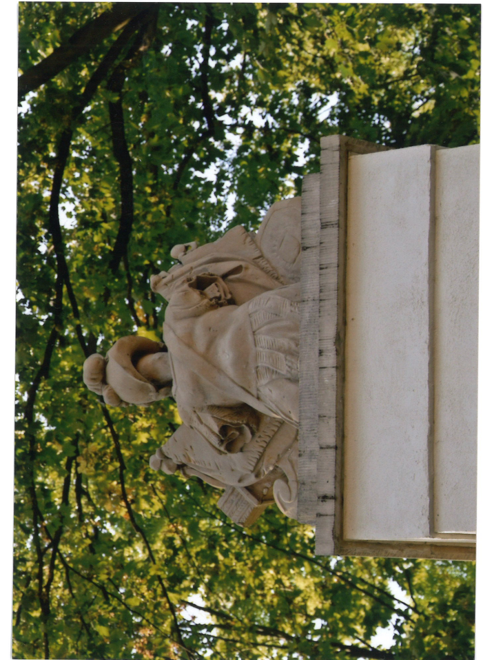
Fot.5. Widok od zachodu (od strony parku), rzeźba wieńcząca południowa, 2022.