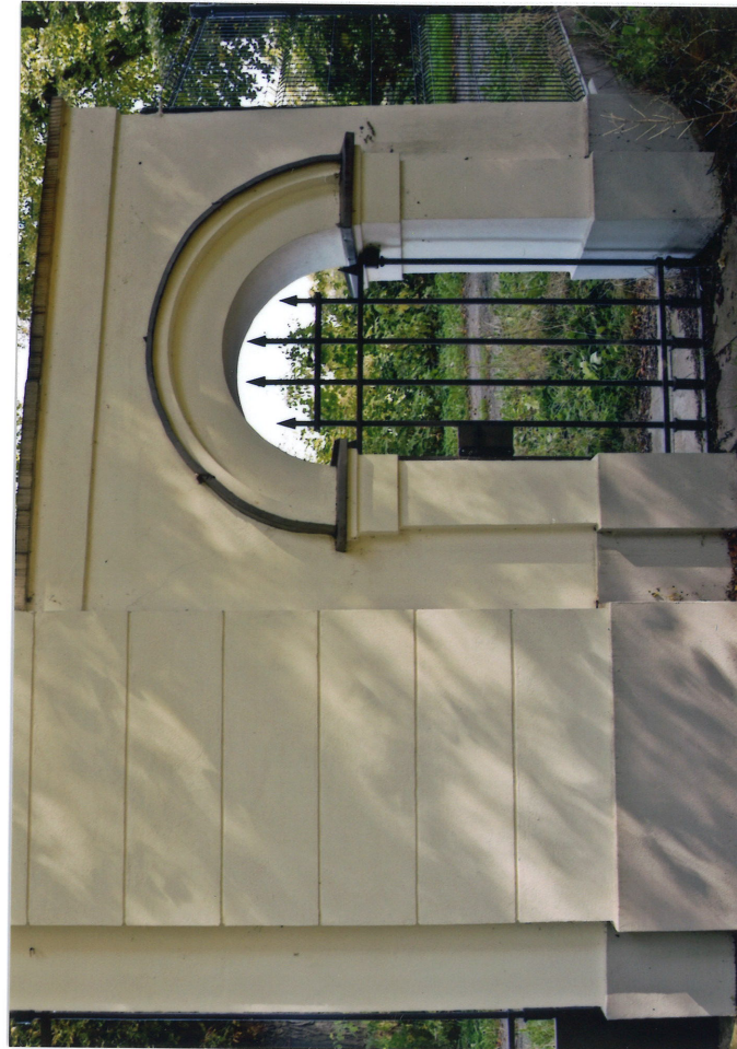
Fot.4. Widok od zachodu (od strony parku), arkada boczna (południowa), 2022.